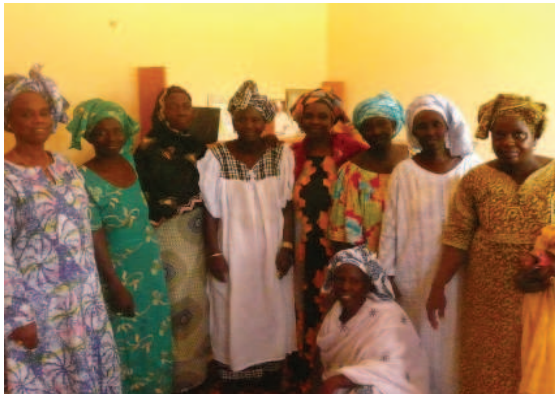
Productrices membres de la coopérative

Pour ce faire, les groupements ambitionnent, dans un premier temps, d'ôter de leurs chaînes de production les tâches à faible valeur ajoutée dont la pénibilité affecte le rendement et nuie à la qualité du produit fini.