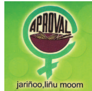
Logo de la coopérative

Les membres pouvant alors se recentrer sur leurs activités principales c'est-à-dire la transformation secondaire de la farine de mil ou de maïs, dorénavant produite par la coopérative, en produits finis et leur commercialisation sur les marchés de proximité.