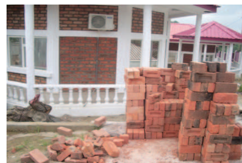
Chantier en cours à Kinkala.

TECH DEV poursuivra son appui technique dans le cadre de ce transfert de technologie du Rwanda vers le Congo (cette technologie pouvant être ensuite répliquée par l'entreprise dans d'autres régions du Congo); Parallèlement, notre partenaire au Congo, le FJEC, accompagnera les équipes opérationnelles de l'entreprise dans ce passage d'une gestion artisanale à une gestion plus industrielle (maîtrise des prix, des délais, des stocks, des commandes, ...).