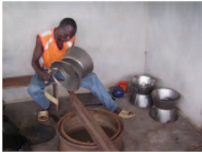
Un ferblantier au travail.

Elle crée de la valeur ajoutée en transformant la ressource locale abondante et peu valorisée qu'est l'argile.