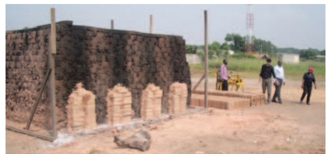
Four actuel qui sera remplacé par un four permanent.

Depuis 1997, l'entreprise individuelle de Madame MABIALA fabrique artisanalement (fours temporaires) des briques cuites à base d'argile dans la banlieue de Brazzaville. Les briques crues étant empilées de telle sorte qu'elles forment le foyer (fours temporaires) ; l'efficacité énergétique est très faible et plus de 30% des briques sont trop ou pas assez cuites, donc rebutées.